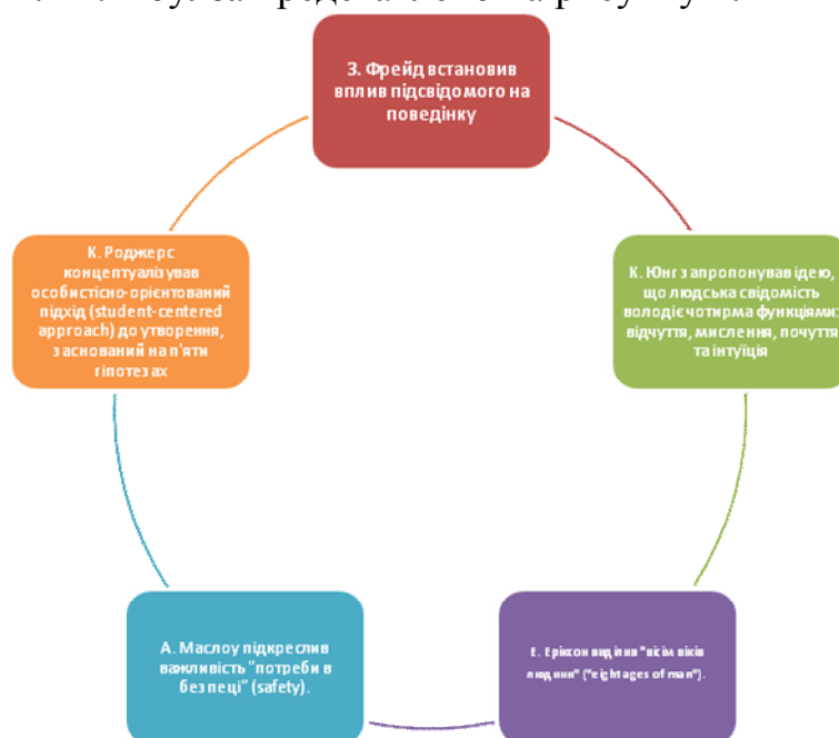
Рис. 1. Теоретичні положення для андрагогічної концепції.

Основні теоретичні положення, що закладені в андрагогічну концепцію М. Ш. Ноулза представлено на рисунку 1.