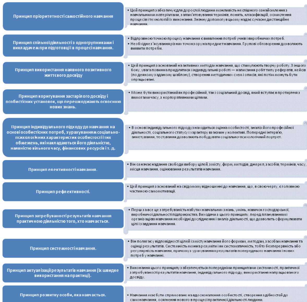
Рис. 3. Основні принципи андрагогіки.

У сучасній науці виділяють наступні основні принципи андрагогіки: принцип пріоритетності самостійного навчання, принцип спільної діяльності з одногрупниками і викладачем при підготовці і в процесі навчання, принцип використання наявного позитивного життєвого досвіду, принцип коригування застарілого досвіду і особистісних установок, що перешкоджають освоєнню нових знань, принцип індивідуального підходу до навчання на основі особистісних потреб, з урахуванням соціально-психологічних характеристик особистості і тих обмежень, які накладаються його діяльністю, наявністю вільного часу, фінансових ресурсів і т.д., принцип елективності навчання, принцип рефлексивності. Основні принципи андрагогіки представлено на рисунку 3.